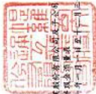
廣州西及通工業股份有限公司 合併現金流量表 民國一〇二年及一〇二一年一月一日至十二月三十一日